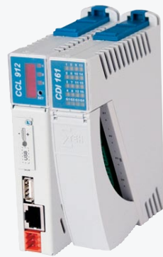
CPU för förvärv av maskindata