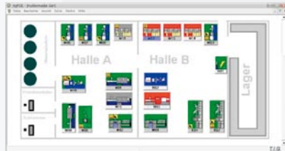
Kontroll centrum: hall layout