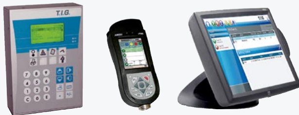
Liten Grafikterminal, PDA, Touchterminal