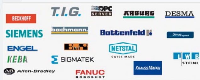
Exempel på leverantörer med gränssnitt